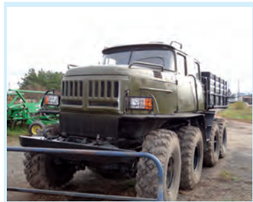
«А вам слабо?» Стр. 6