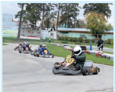
Есть чем гордиться! Стр. 4