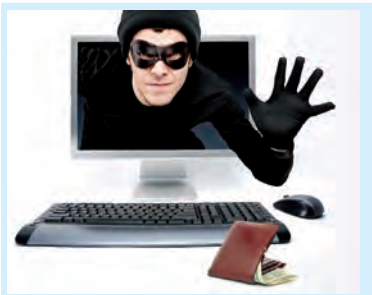
Мошенники в онлайн-режиме Стр. 5